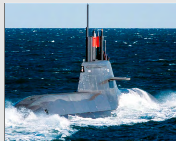
Bohnhoff on "U 212"