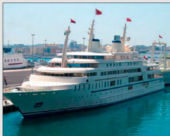
Bohnhoff on a "Privat Yacht"