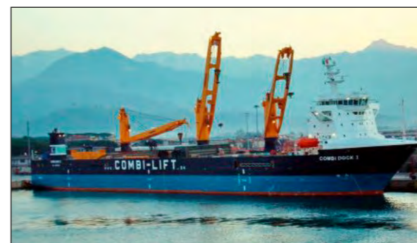
CARAVELLE® on MV "Combi Dock 1"