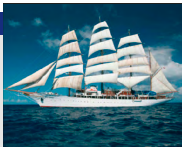
Bohnhoff on SY "Sea Cloud"